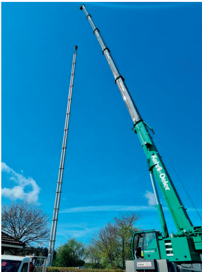
Pumpenersatz beim GWPW Mattstetten